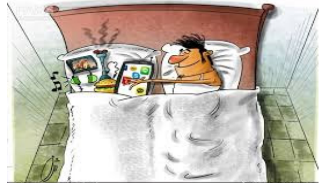
کاریکاتور: رضا باقری شرف