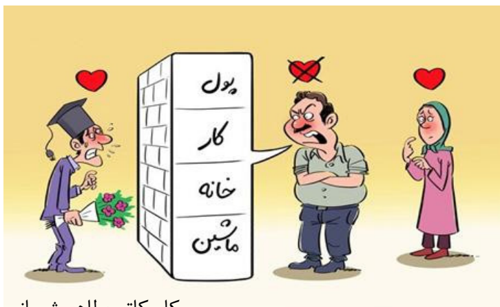
کاریکاتور: طاهر شعبانی