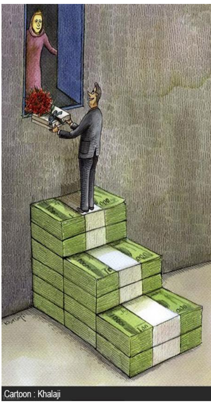
Cartoon : Khalaji

را استفاده میکرد و دختر به هیچ عنوان به آن نام استنادی نداشت. به نحوی که اگر اطلاعات ابتدایی نام خانوادگی و دیگر مسائل را نمیدانستید قطع احساس می کردید که تفاوت فاحش دارند. یکی اهل تهران و دیگری اهل شهرستان است. این آموزه یعنی اگر دقت خود را بالا ببرید در گفته ها به کشف چنین کلامهایی که اشاره شد خواهید رسید و می توانید در انتخاب خود بکار گیرید. شاید این پرسش را بپرسید که چه اشکالی دارد؟ و کجا می تواند دردسرساز شود؟ مگر ایرادی دارد سرمایه گذاری در وطن؟ این یک انتخاب خوب اقتصادی است، چرا نگاه بد دارید و آن را ایراد می دانید؟ آفرین به این پسر. پسرهایی هستند که اصلن تعهد ندارند و فقط به دنبال ولگردی و بی تعهدی هستند؟ در ماه بعد ماهنامه بخوانید تا تک تک جوابها را بدانید. ادامه دارد ... نویسنده: دکتر یاسر اصلانی