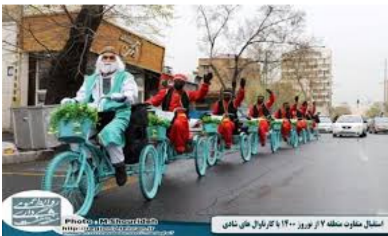
استقبال متفاوت سلفه ۷ از نوروز ۱۴۰۰ با کار باوال خان شادی