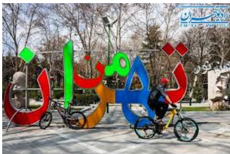
باشگاه خبرنگاران پویا